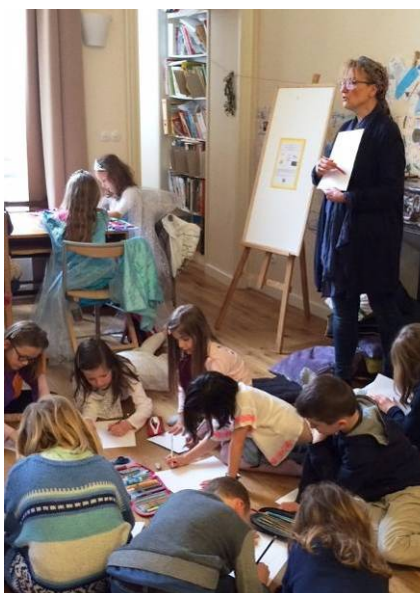
Slavnost čtení v ČŠBH Paříž

Na to navázaly dvě knihy, Vyprávění ze Starého zákona a Vyprávění z Nového zákona, které byly oceněny v zahraničí i v Čechách. První kniha dostala cenu na bienále v Teheránu a zápis na čestnou listinu IBBY (pozn.: Jde o významné mezinárodní ocenění pro tvůrce dětských knih.) a druhá dostala „Nejkrásnější knihu“ v Čechách. Tak jsem dospěla na pomyslný vrchol tvorby a tím skončilo mé předmateřské období.